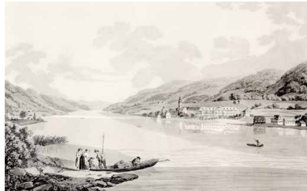
© Runk-Ziegler, Stift Ossiach, um 1810 Quelle: Kärntner Landesarchiv

UNKOSTENBEITRAG: 35,- Euro / Kinder 17,- (inklusive Essen/Getränk, Eintritte, Rückreise) INFO + ANMELDUNG: T 0676/845870110 E office@kulturradpfade.at W www.kulturradpfade.at