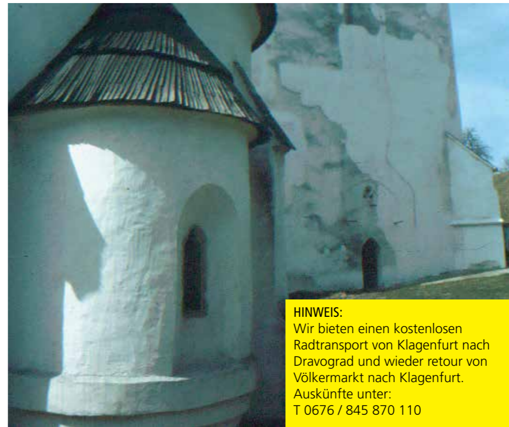
Kirche St. Agnes, © Wilhelm Deuer