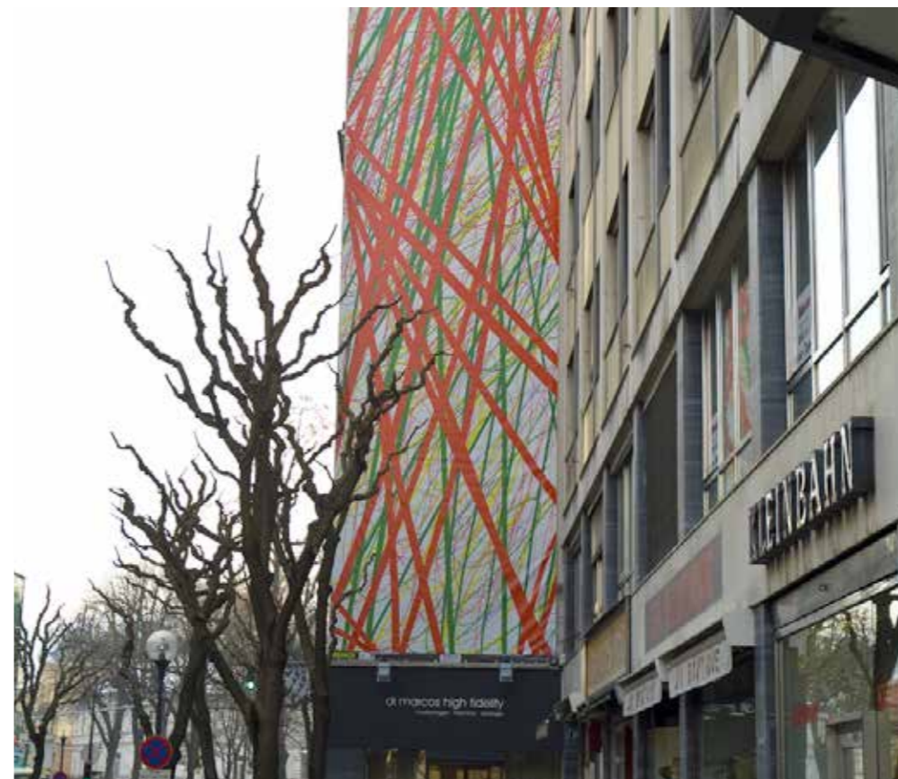
© Armin Guerino, Wettbewerbsprojekt Bahnhofstraße 26, Klagenfurt, 2009

UNKOSTENBEITRAG: 29,- (Kinder: 15,-) inklusive 1 Essen + Getränk INFO + ANMELDUNG: T 0676/845 870 110 E office@kulturradpfade.at