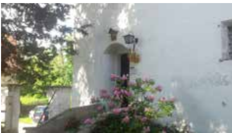
Tonhof Maria Saal