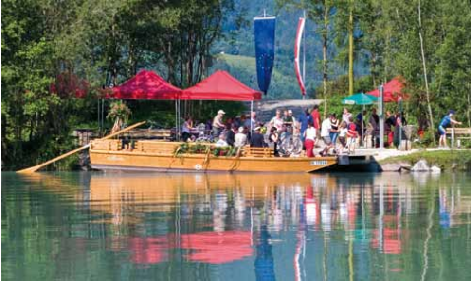
Die Hofläure zwischen Lansach und Fefernitz.